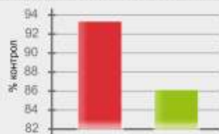
Листни въшки - Aphis gossypii

■ Ланат® 25 ВП - 100 г/дка ■ Dimethoate - регистрирана доза